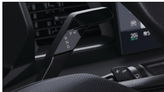
Växelspak för 9-stegad automat