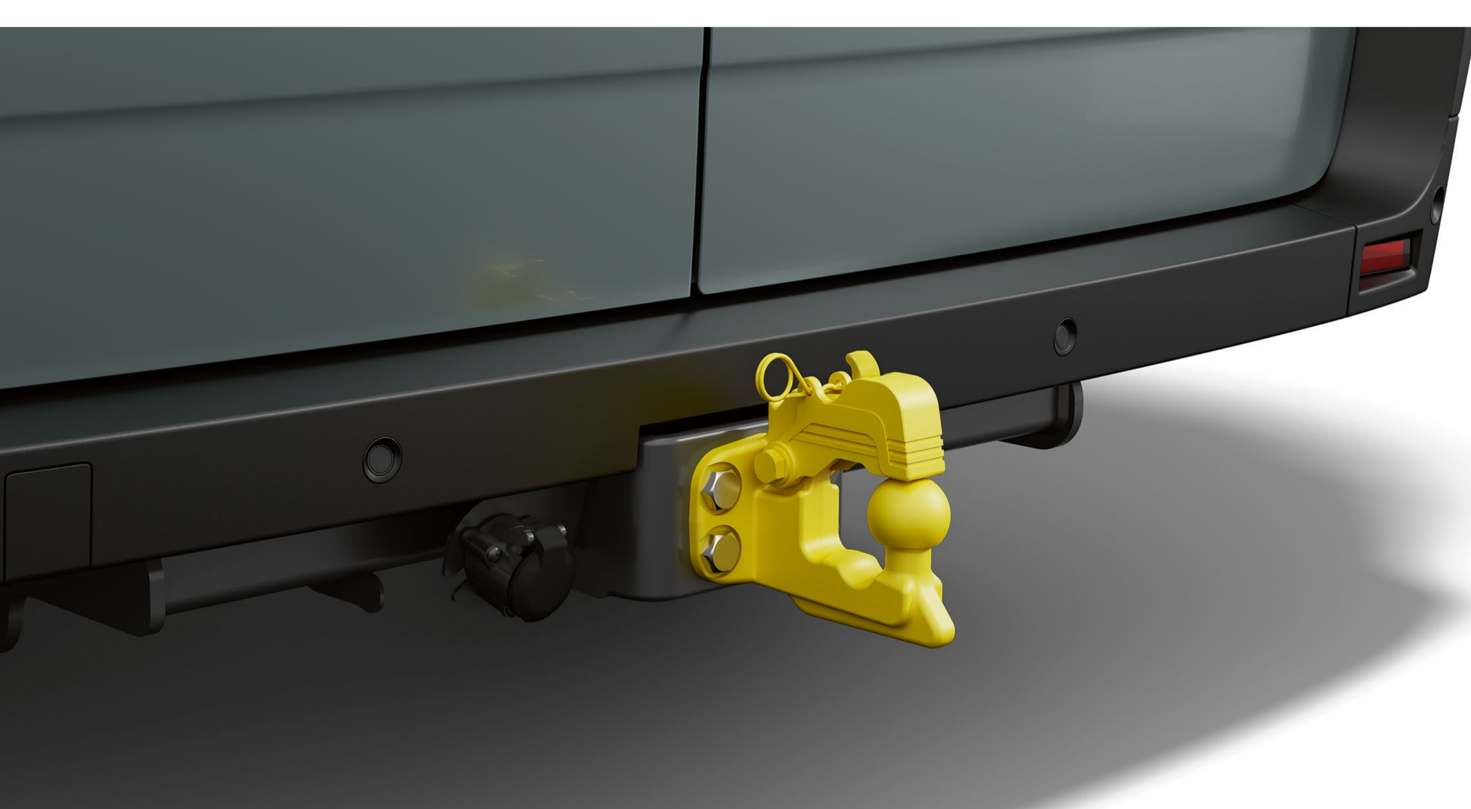
dragkrok, 4-bultad med spärr

Ett tryggt val. Dragkroken som hålls på plats med fyra bultar är utrustad med en spärr som garanterar högsta säkerhet och trygga transporter.