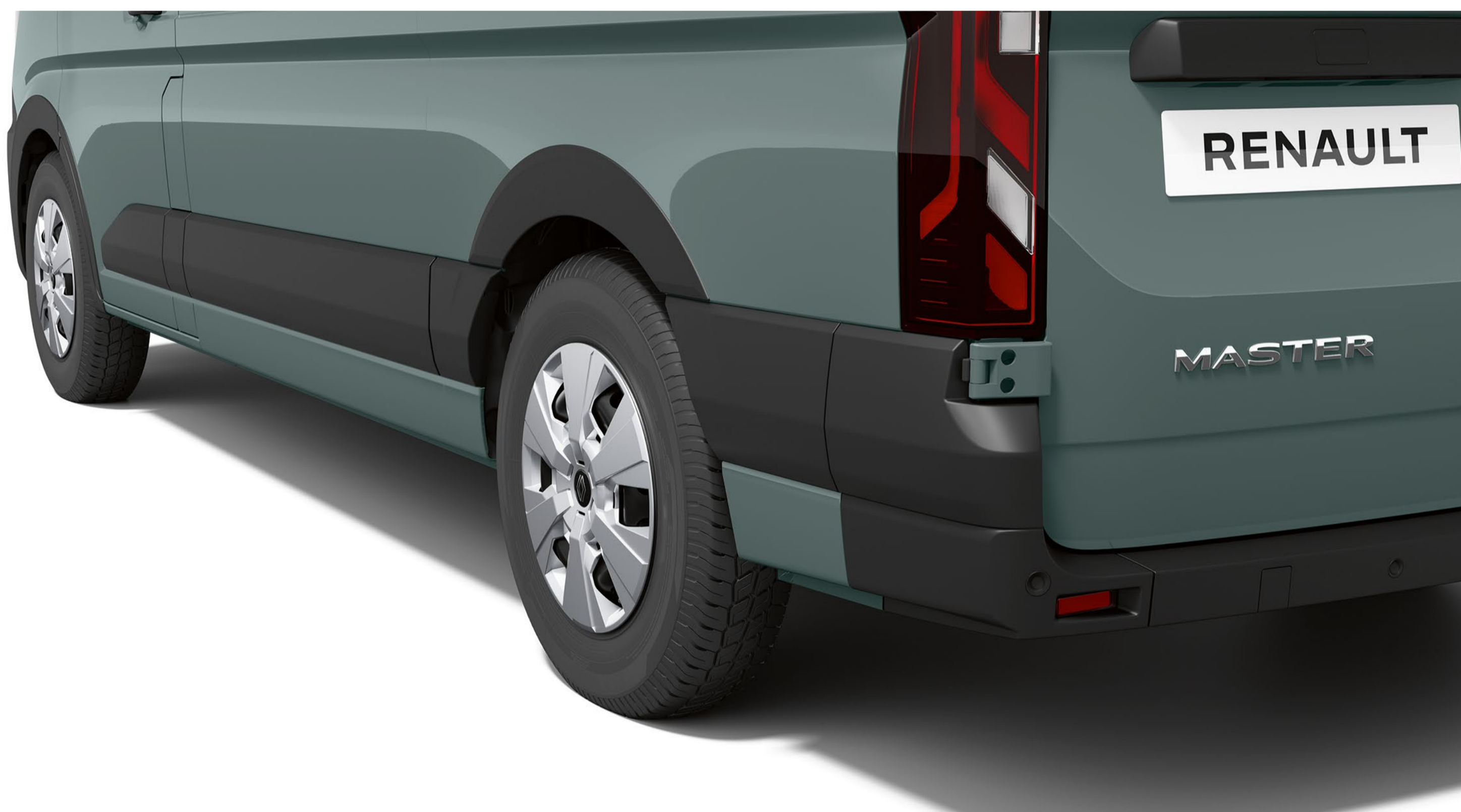
främre och bakre hjulhusskydd

Våra brandsläckare uppfyller europeiska standarder och monteras i fästen som genomgått krocktester. Med andra ord sitter de säkert på plats samtidigt som de är lättillgängliga vid behov.