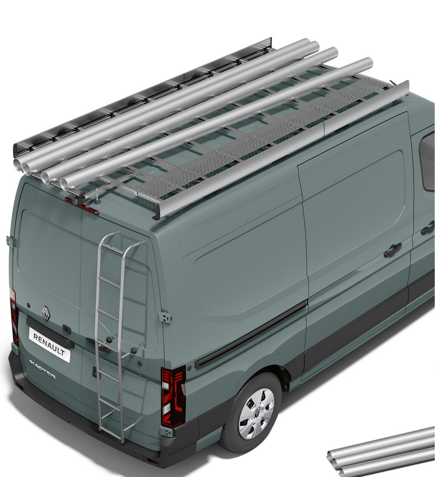
lastkorg och stege

Du kan utrusta nya Master med upp till fem stycken lasthållare (2) för utökad lastkapacitet, samt för att kunna montera tillbehör som varsel- eller extraljus.