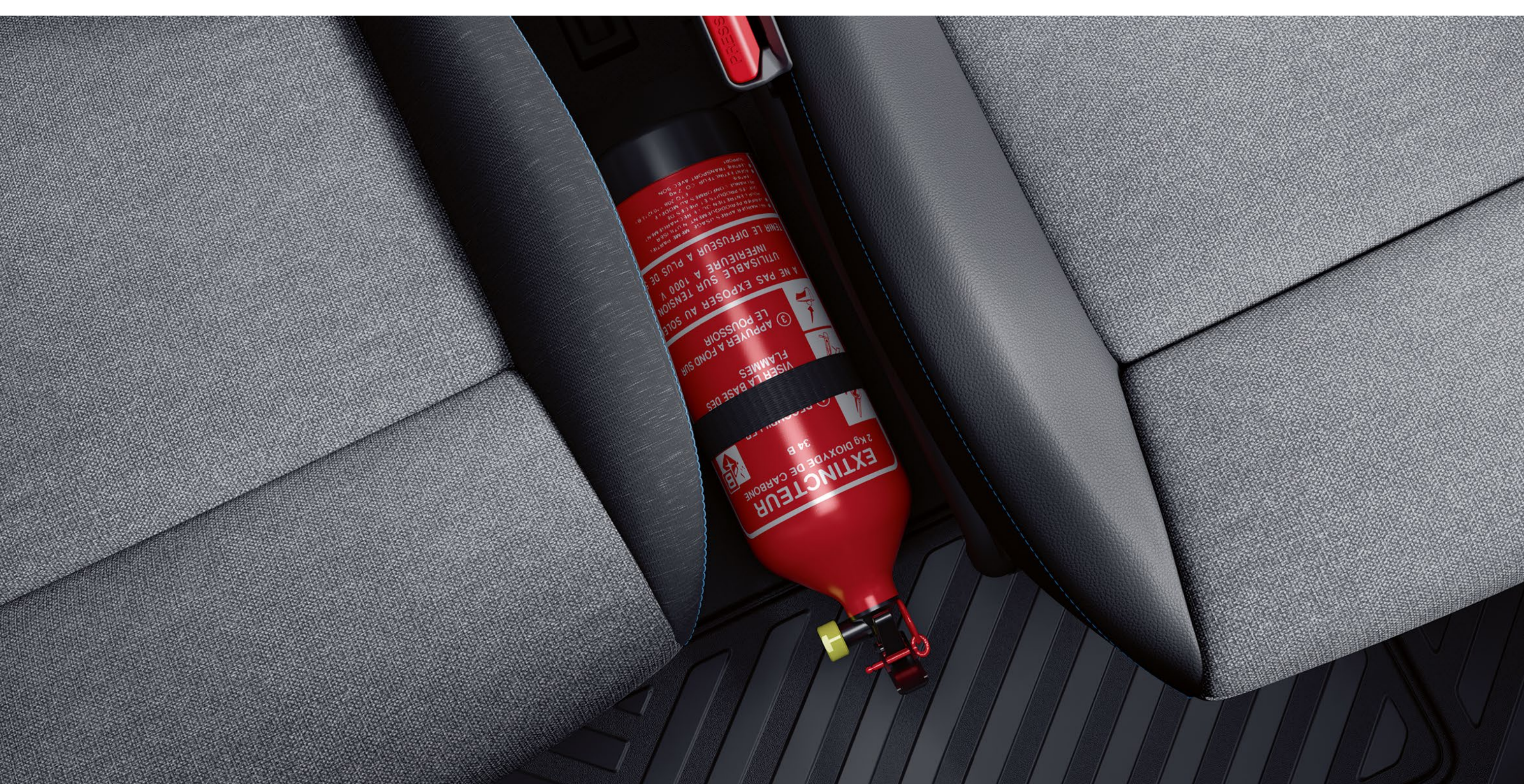
brandsläckare och fäste

Våra brandsläckare uppfyller europeiska standarder och monteras i fästen som genomgått krocktester. Med andra ord sitter de säkert på plats samtidigt som de är lättillgängliga vid behov.