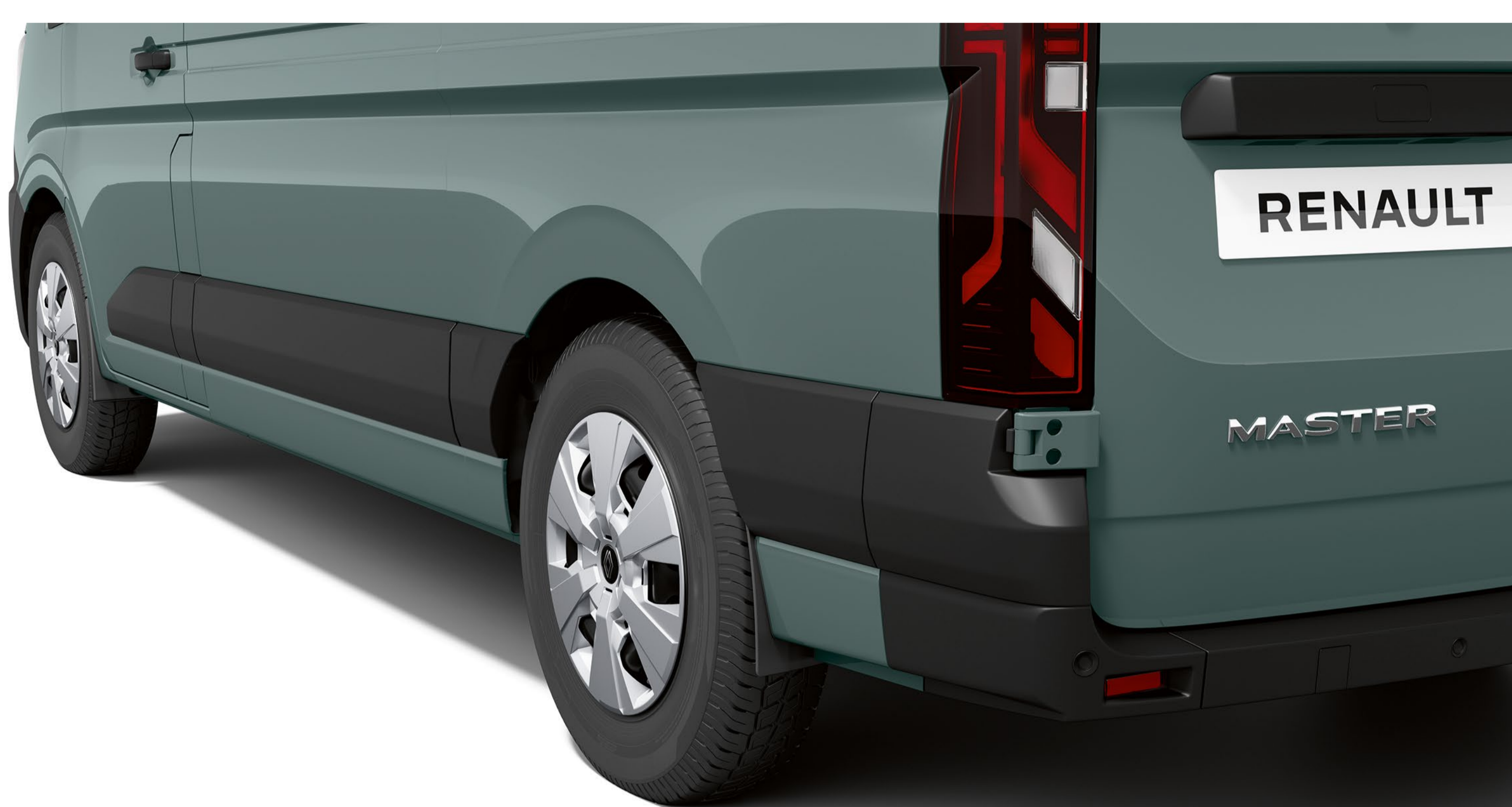
främre och bakre stänkskydd

Saltblandad slask, sten, lera och grus. Skydda din nya Master från elementen med praktiska stänkskydd och hjulhusskydd.