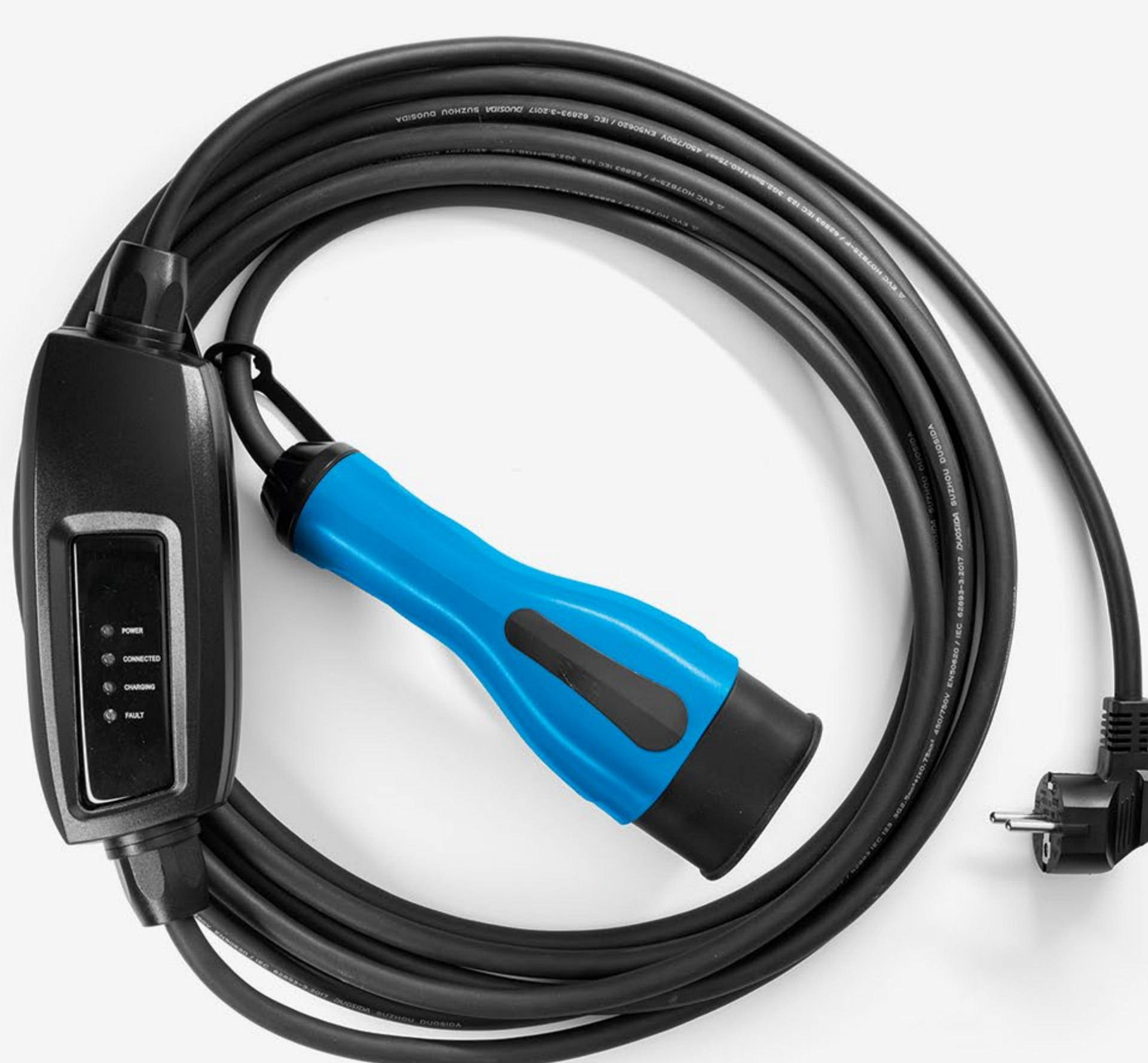
laddkabel för standarduttag

En mode 3-kabel ingår när du köper nya Master E-Tech 100% electric, vilket gör att du kan ladda vid laddboxar eller på offentliga stationer. Vill du kunna ladda från vanliga hushållsuttag kan du köpa till laddaren för standarduttag.