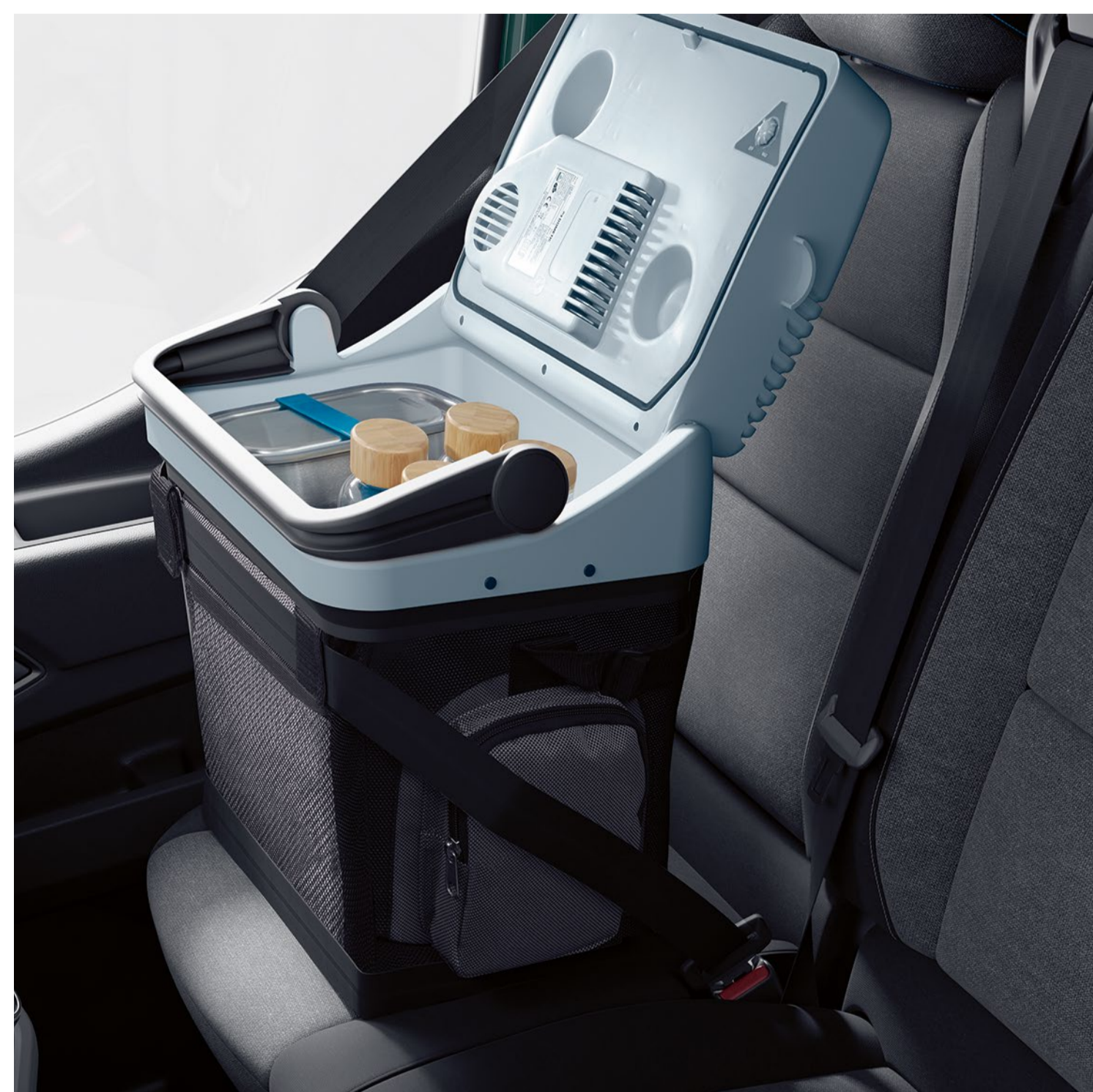
kylväska 12 V-220 V