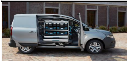
Smart hyllösning från Sortimo tillsammans med Open Sesame!