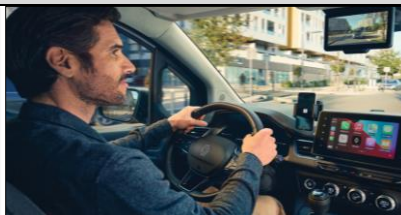
Förarmiljön med digital backspegel