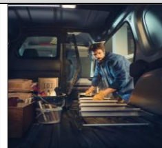
Lasta långa föremål från sidan!

3-års nybilsgaranti/100 000km (läs mer på www.renault.se ).