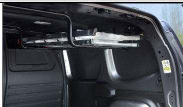
Med Easy Inside Rack för du undan långa föremål från golvet med genomlastningslyckan ovanför passageraren